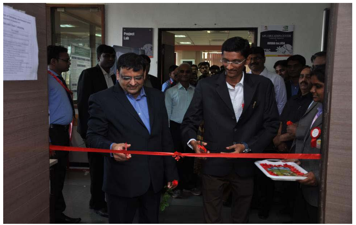
Inauguration of Center of Excellence for BigData Analytics & Cloud Computing