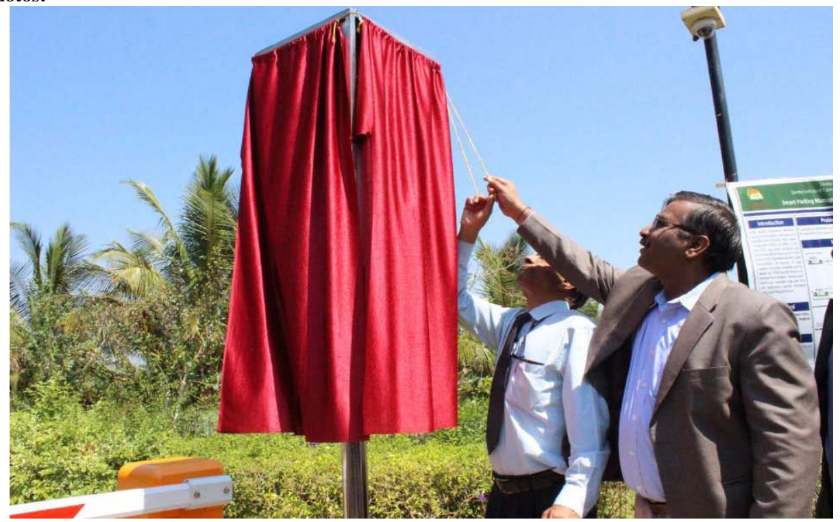
Inauguration of Parking Project